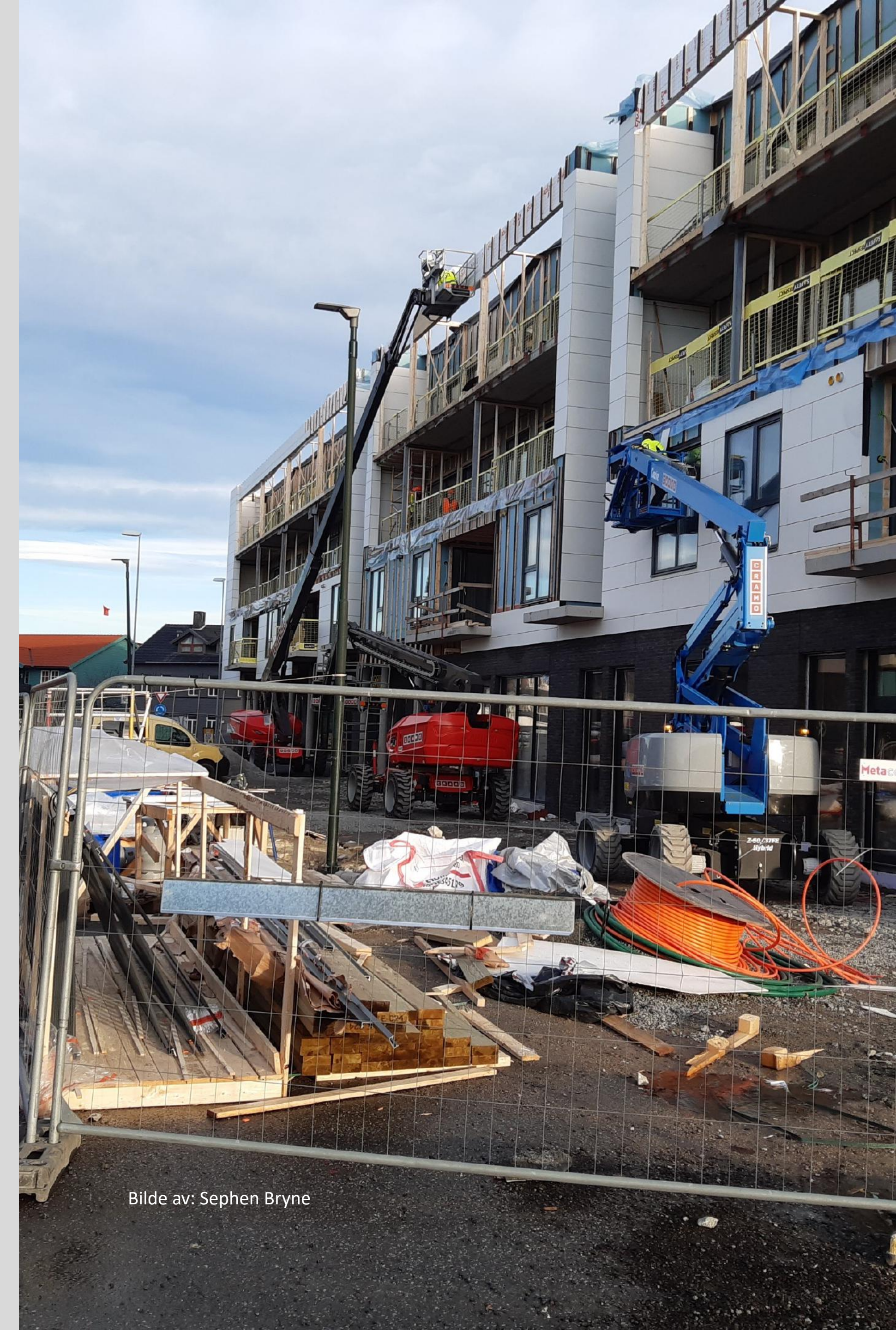
Bilde av: Sephen Bryne